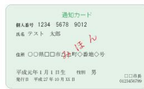
(表) 通知カード (裏)