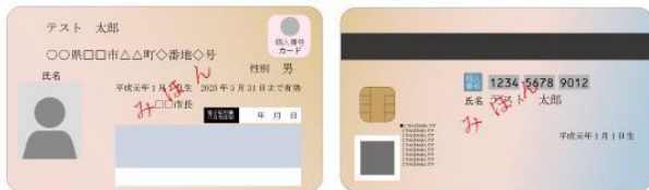
(表) 個人番号カード (裏)